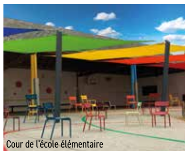
Cour de l'école élémentaire