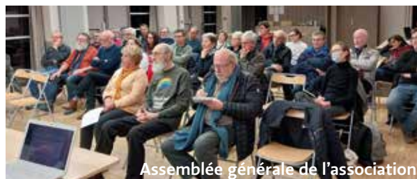
Assemblée générale de l'association

> Jeudi 27 mars, Salle Alfred Domagala à Ingré, à 20h