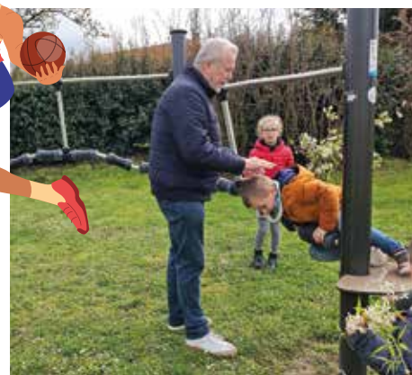
Aménagement du Parc de la Sagette