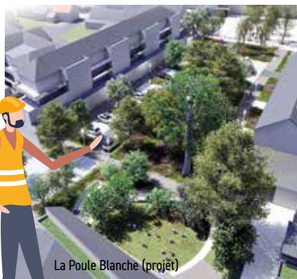
La Poule Blanche (projet)

ACTION SCOLAIRE, ENFANCE, JEUNESSE, SENIORS